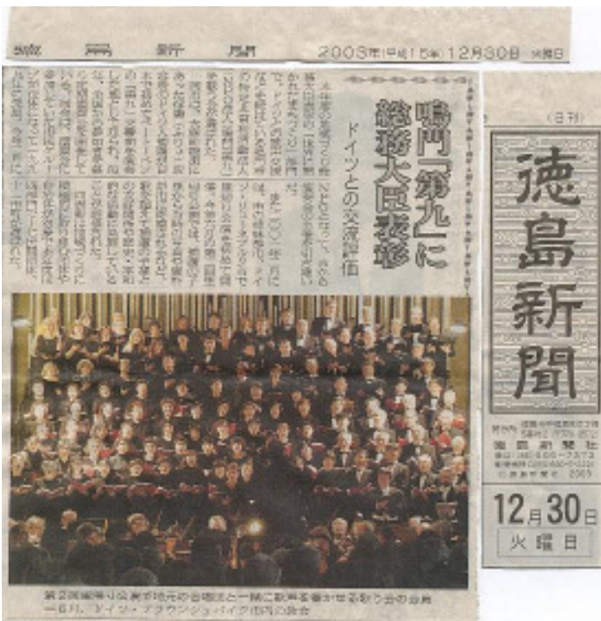
2. Heimkehrkonzert im Dom in Braunschweig