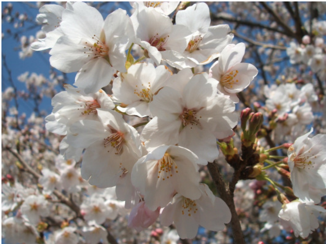
(Sakura-Aufnahme von Tokushi Nishijima) JDG -Toyohashi, 2006